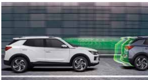
FVSA 前車啟動警報系統