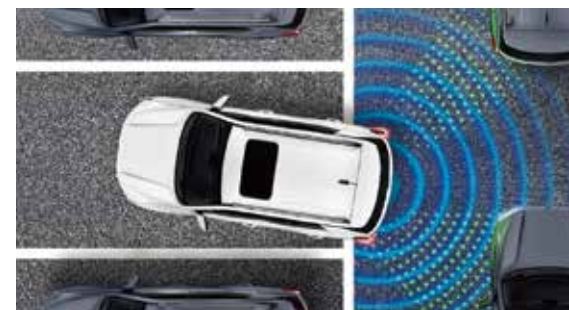
RCTA 後方車側警示系統