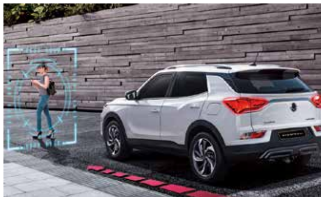
BAS 煞車力道輔助系統