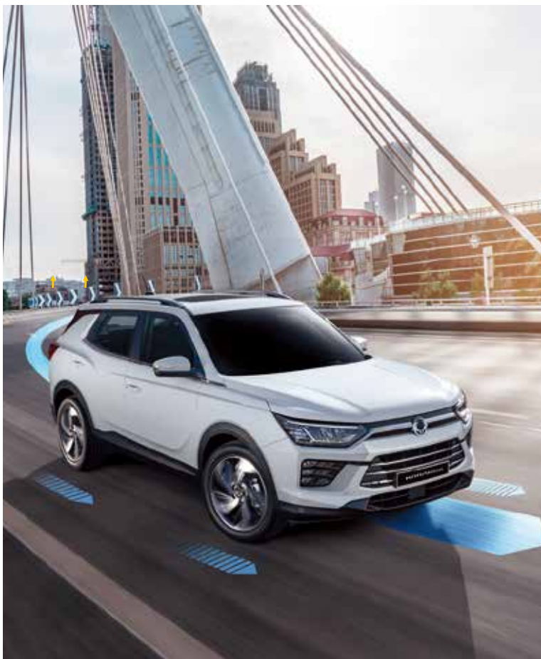
ARP 主動式側翻防止系統