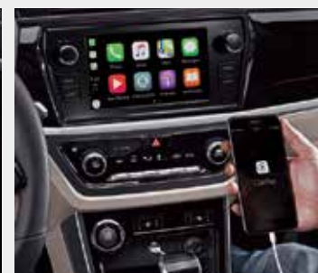
10吋大螢幕中控面板 (8吋影音主機-附Apple Carplay 與 Android Auto)