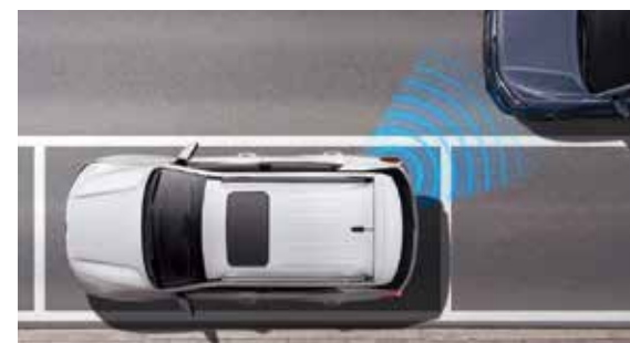
EAF 車門開啟後方來車偵測輔助功能