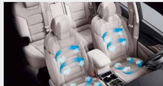
雙前座通風座椅(三段風量調整)