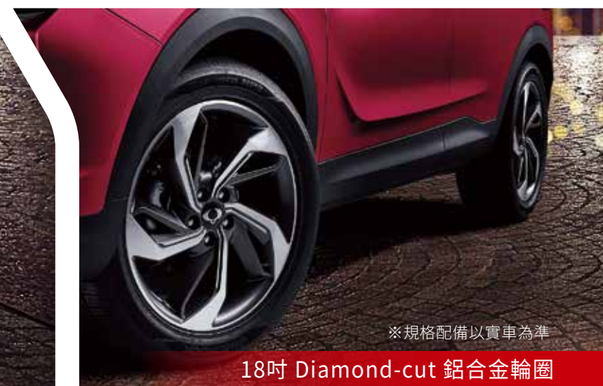
※規格配備以實車為準