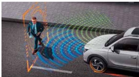
AEBS 自動輔助緊急煞車系統