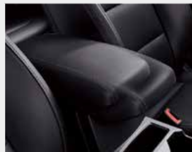
前後滑移可調整中央扶手