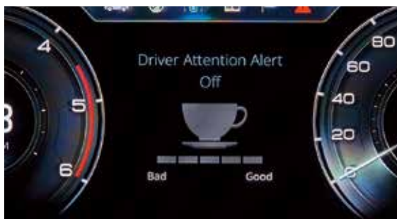
DAA 疲勞駕駛警示系統