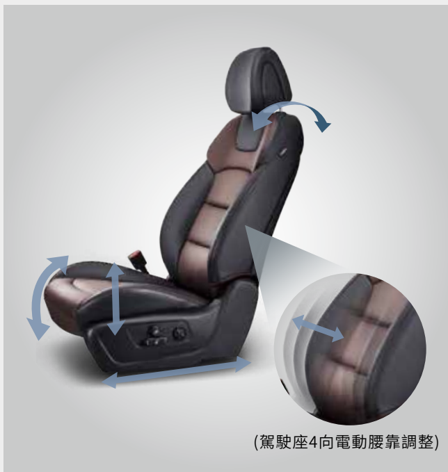
雙前座8向電動座椅