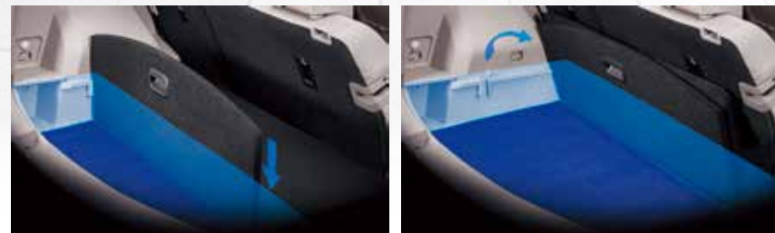
行李廂可拆式魔術托盤

可放4組高爾夫球具+4件桿弟袋，也適合放入大型的休閒露營用具 內寬：1,350mm / 內高：889mm / 內深：815mm / 容積：(VDA)213公升，(最大)551公升