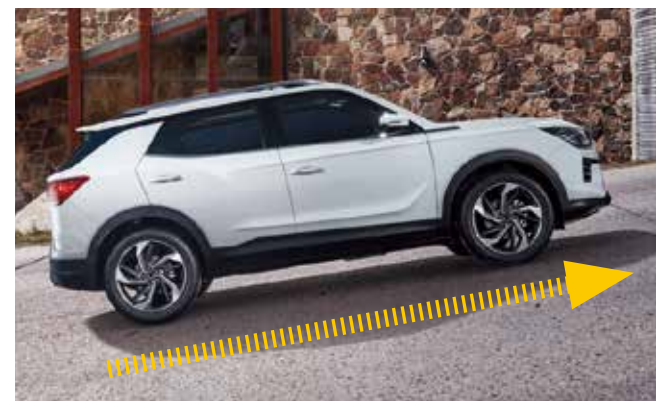
HSA 斜坡起步輔助系統

※所有主、被動安全配備均有條件限制，相關限制請洽全國經銷商了解車主手冊內相關說明。