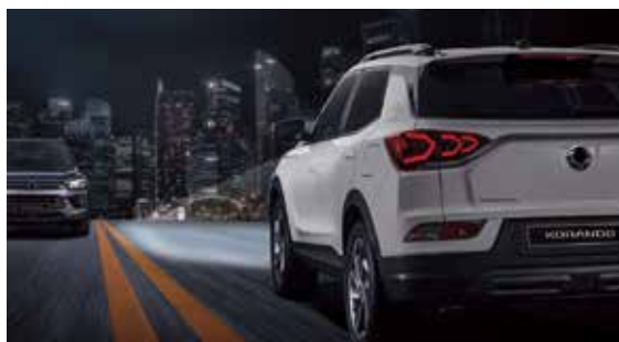
HBA 智慧型遠光燈輔助系統