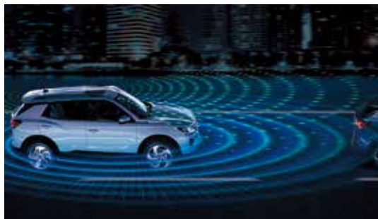
IACC 自主智慧適應型定速巡航