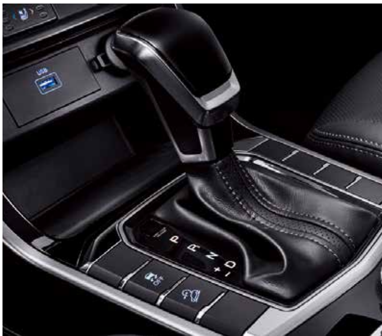
AISIN 6速高扭矩手自排變速箱