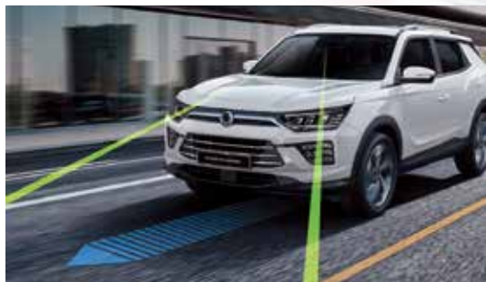
LDW 車道偏移警示系統