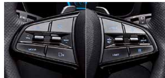
方向盤快撥鍵(含巡航操作)