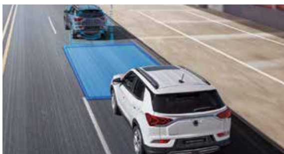
SDA 安全車距警示系統