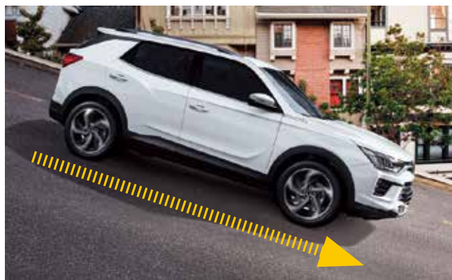
HDC 陡坡緩降控制系統