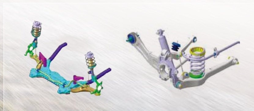
前麥花臣+後多連桿式懸吊