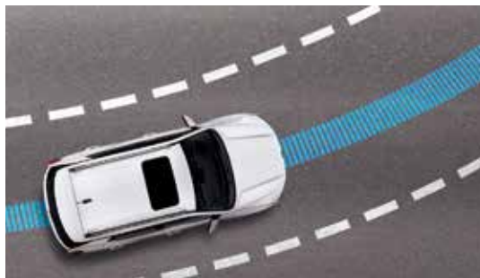
LCFA 遵循車道置中輔助系統