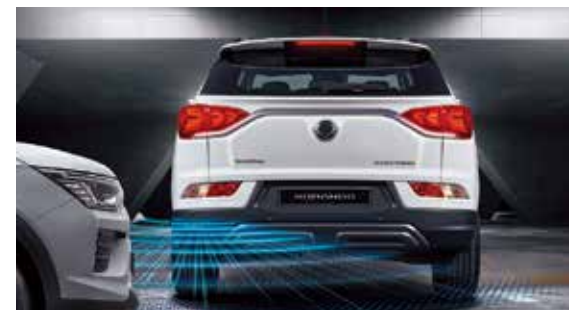
RCTA-i 倒車煞車輔助系統