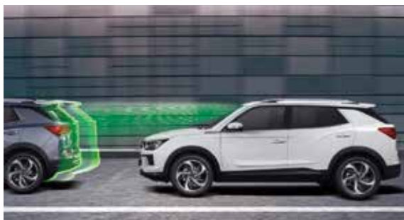
FCW 前方碰撞警告系統