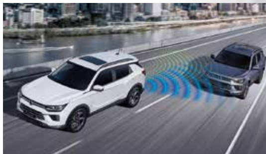
LCA 變換車道輔助系統