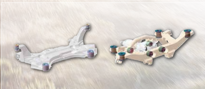
前軸強化副樑+後軸強化副樑